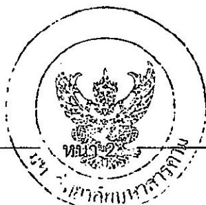
(นายศิริโรจน์ ตั้งอารยทรัพย์) นักทัศนมาตร