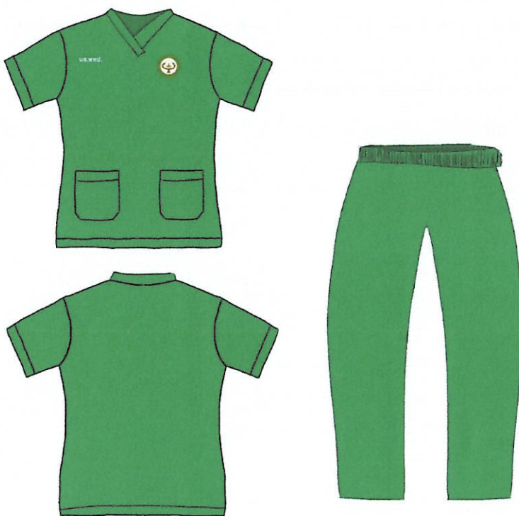
ภาพประกอบที่ ๖ เครื่องแบบและเครื่องแต่งกายชั้นคลินิกนิตตสาขาการแพทย์แผนไทยประยุกต์ สำหรับฝึกปฏิบัติงานในสถานพยาบาล และในห้องคลอด

ข้อ ๒.๒.๒ เครื่องแบบชุดสครับ เป็นเครื่องแบบของนิตตชั้นคลินิก ที่ใช้สวมใส่ในสถานที่ฝึกปฏิบัติงานในสถานพยาบาลชั้นคลินิก และสวมใส่ในการฝึกปฏิบัติงานในห้องคลอด แบบเสื้อสำหรับนิตตชายและนิตตหญิงเป็นสีเขียวเข้ม เนื้อผ้าไม่หนาไม่บางจนเกินไปและไม่มีลวดลาย เสื้อคอวีแบบคอตัน ด้านหน้าของเสื้อมีกระเป๋าแบบแปะ จำนวน ๒ ใบ ขนาดกว้าง ๑๐ เซนติเมตร ยาว ๑๒ เซนติเมตร ติดบริเวณชายเสื้อด้านล่าง ข้างละ ๑ ใบ ที่หน้าอกขวา ปักคำว่า นส.พทป.ตามด้วยชื่อ-สกุล (นส.พทป.ชื่อ-สกุล) ด้วยด้ายสีขาวหนา ๑ มิลลิเมตร สูง ๑ เซนติเมตร ที่หน้าอกซ้าย ปักตราสัญลักษณ์คณะแพทยศาสตร์ มหาวิทยาลัยมหาสารคาม เส้นผ่านศูนย์กลาง ๖ เซนติเมตร กางเกงทรงกระบอกยาวไม่รัดรูป ความยาวตามความเหมาะสมเดียวกับแบบเสื้อ กระเป๋าด้านข้างแบบเจาะ นิตตชายและนิตตหญิง สวมรองเท้าตามแบบที่สถานพยาบาลนั้นกำหนด เครื่องแต่งกายนี้ห้ามใส่ออกนอกสถานพยาบาล (ภาพประกอบที่ ๖)