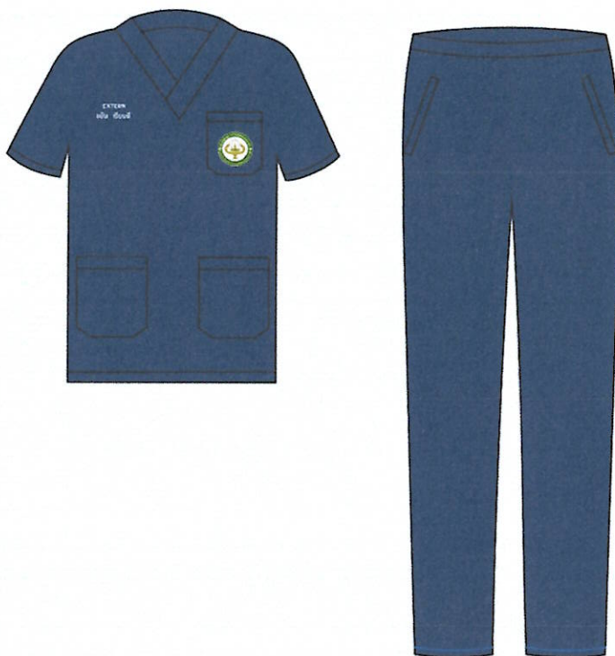
ภาพประกอบที่ ๔ เครื่องแบบและเครื่องแต่งกายชั้นคลินิก สำหรับนิสิตสาขาแพทยศาสตร์ ชั้นปีที่ ๒ นอกเวลาราชการ