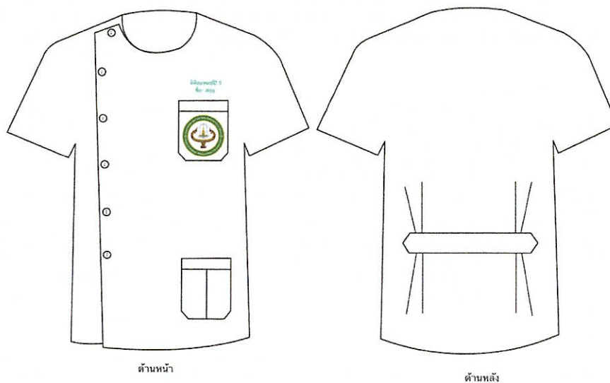
ภาพประกอบที่ ๒ เครื่องแบบและเครื่องแต่งกายชั้นคลินิก สำหรับนิตินสาขาแพทยศาสตร์ ชั้นปีที่ ๕