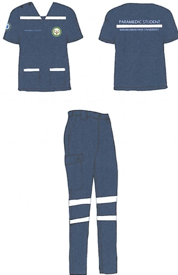
ภาพประกอบที่ ๘ เครื่องแบบและเครื่องแต่งกายชั้นคลินิกนิสิตสาขาฉุกเฉินการแพทย์ สำหรับฝึกปฏิบัติงานภาคสนาม นอกสถานพยาบาล

ตัวเสื้อแบบแขนสั้นมีسابหนา ๒ เซนติเมตร แขนเสื้อด้านซ้ายมีช่องสำหรับเสียบปากกาแบบแปะกว้าง ๓ เซนติเมตร ยาว ๑๒ เซนติเมตร แบ่งเป็น ๒ ช่อง เท่า ๆ กัน แขนเสื้อด้านขวาติดตราสัญลักษณ์สาขาฉุกเฉิน การแพทย์ ขนาดเส้นผ่าศูนย์กลาง ๕ เซนติเมตร ชายเสื้อตรง แบบเสื้อผ่าจากคอเสื้อถึงไหล่ขวาไม่มีساب มี กระดุมสีน้ำเงินที่ไหล่ขวา ๒ เม็ด ด้านหน้าของเสื้อส่วนล่างมีกระเป๋าแบบแปะ ขนาดกว้าง ๑๐ เซนติเมตรยาว ๑๒ เซนติเมตร ทั้งซ้ายและขวาข้างละ ๑ ใบ ด้านบนกระเป๋ามีแถบสะท้อนแสงสีเงิน หนา ๒ เซนติเมตร หน้าอกด้านซ้าย ปักตราสัญลักษณ์คณะแพทยศาสตร์ มหาวิทยาลัยมหาสารคาม ขนาดเส้นผ่าศูนย์กลาง ๖ เซนติเมตร หน้าอกด้านขวาปักชื่อและนามสกุล (ไม่มีค่านำหน้าชื่อ) ด้วยอักษรตัวพิมพ์ใหญ่ภาษาอังกฤษสูง ๑ เซนติเมตรด้วยเส้นด้ายสีขาว ติดแถบสะท้อนแสงสีเงิน หนา ๒ เซนติเมตรเหนือคอวี ไม่เกินเส้นขอบที่เย็บساب ด้านใน ตามแนวเส้นตรงลายนอน โดยเว้นบริเวณผ้าที่ติดสาปตรงตำแหน่งคอวี ด้านหลังเสื้อเรียบและไม่มีساب และปักอักษรคำว่า PARAMEDIC STUDENT สูง ๒.๕ นิ้ว ด้วยเส้นด้ายสีขาวบรรทัดบนและคำว่า MAHASARAKHAM UNIVERSITY สูง ๑.๕ นิ้ว ด้วยเส้นด้ายสีขาวบรรทัดล่าง โดยมีแถบสะท้อนแสงสีเงินหนา ๓.๕ เซนติเมตร คั่นระหว่างบรรทัดบนและบรรทัดล่าง กางเกงทรงกระบอก ความยาวคลุมข้อเท้า สีน้ำเงินสว่าง กระเป๋าด้านหน้าแบบเจาะ กระเป๋าด้านข้างแบบแปะเรียบเหนือเข่า ล่างกระเป๋าด้านข้างติดแถบสะท้อนแสงสีเงินหนา ๒ เซนติเมตร สวมเข็มขัดมหาวิทยาลัยมหาสารคาม สวมรองเท้าผ้าใบหุ้มส้นสีสุภาพ (สีดำ สีกรมท่า สี เทา สีขาว สีน้ำเงิน หรือน้ำตาลเข้ม) ไม่มีลวดลาย ถุงเท้าสีดำหรือสีสุภาพ (ภาพประกอบที่ ๘)