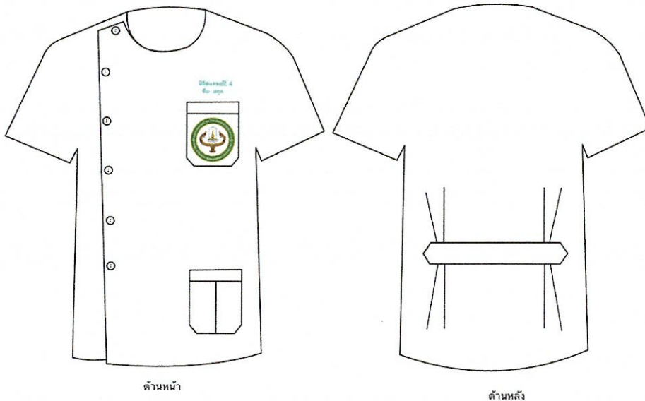
ภาพประกอบที่ ๑ เครื่องแบบและเครื่องแต่งกายชั้นคลินิก สำหรับนิตินสาขาแพทยศาสตร์ ชั้นปีที่ ๔

นิตินแพทย์ชั้นปีที่ ๔-๕ บนหน้าอกเสื้อด้านซ้ายเหนือกระเป๋าเสื้อปักคำว่า นิตินแพทย์ปี ๔ (ภาพประกอบที่ ๑) หรือ ๕ (ภาพประกอบที่ ๒) ตามระดับชั้นปี อยู่เหนือ ชื่อ-สกุล ทั้งหมดนี้ปักด้วยด้ายสีเขียว ขนาดตัวอักษรหนา ๑ มิลลิเมตร สูง ๑ เซนติเมตร ระยะห่างบรรทัด ๑ เซนติเมตร สำหรับนิตินแพทย์ชั้นปีที่ ๖ บนหน้าอกเสื้อด้านซ้ายเหนือกระเป๋าเสื้อปักคำว่า EXTERN (ตัวพิมพ์ใหญ่) ด้วยด้ายสีแดง อยู่เหนือ ชื่อ-สกุล ปักด้วยด้ายสีเขียว (ภาพประกอบที่ ๓) ขนาดตัวอักษรหนา ๑ มิลลิเมตร สูง ๑ เซนติเมตร ระยะห่างบรรทัด ๑ เซนติเมตร กระเป๋าใบที่ ๒ ติดชายเสื้อด้านซ้าย กว้าง ๑๐.๕ เซนติเมตร ยาว ๑๒ เซนติเมตร ด้านหลังมีจีบคู่และมีสายคาดเอวกว้าง ๑ นิ้ว