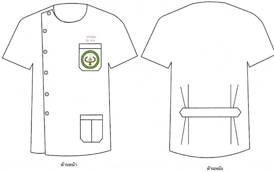
ภาพประกอบที่ ๓ เครื่องแบบและเครื่องแต่งกายชั้นคลินิก สำหรับนิสิตสาขาแพทยศาสตร์ ชั้นปีที่ ๖