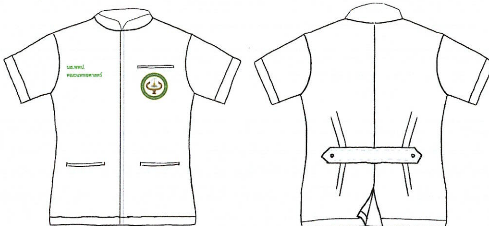
ภาพประกอบที่ ๕ เครื่องแบบและเครื่องแต่งกายชั้นคลินิกนิตตสาขาการแพทย์แผนไทยประยุกต์ สำหรับฝึกปฏิบัติงานในและนอกสถานพยาบาล

ข้อ ๒.๒.๒ เครื่องแบบชุดสครับ เป็นเครื่องแบบของนิตตชั้นคลินิก ที่ใช้สวมใส่ในสถานที่ฝึกปฏิบัติงานในสถานพยาบาลชั้นคลินิก และสวมใส่ในการฝึกปฏิบัติงานในห้องคลอด แบบเสื้อสำหรับนิตตชายและนิตตหญิงเป็นสีเขียวเข้ม เนื้อผ้าไม่หนาไม่บางจนเกินไปและไม่มีลวดลาย เสื้อคอวีแบบคอตัน ด้านหน้าของเสื้อมีกระเป๋าแบบแปะ จำนวน ๒ ใบ ขนาดกว้าง ๑๐ เซนติเมตร ยาว ๑๒ เซนติเมตร ติดบริเวณชายเสื้อด้านล่าง ข้างละ ๑ ใบ ที่หน้าอกขวา ปักคำว่า นส.พทป.ตามด้วยชื่อ-สกุล (นส.พทป.ชื่อ-สกุล) ด้วยด้ายสีขาวหนา ๑ มิลลิเมตร สูง ๑ เซนติเมตร ที่หน้าอกซ้าย ปักตราสัญลักษณ์คณะแพทยศาสตร์ มหาวิทยาลัยมหาสารคาม เส้นผ่านศูนย์กลาง ๖ เซนติเมตร กางเกงทรงกระบอกยาวไม่รัดรูป ความยาวตามความเหมาะสมเดียวกับแบบเสื้อ กระเป๋าด้านข้างแบบเจาะ นิตตชายและนิตตหญิง สวมรองเท้าตามแบบที่สถานพยาบาลนั้นกำหนด เครื่องแต่งกายนี้ห้ามใส่ออกนอกสถานพยาบาล (ภาพประกอบที่ ๖)