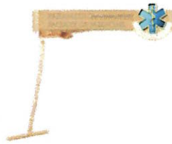
ภาพประกอบที่ ๑๔ เข็มกลัดเนคไทสำหรับนิสิตชาย สาขาฉุกเฉินการแพทย์

นิสิตหญิง เป็นโลหะสีทอง ด้านบนบริเวณเข็มกลัดสำหรับติดปกเสื้อนิสิตเป็นตราสัญลักษณ์ของสาขา ฉุกเฉินการแพทย์ คือ ดวงดาวแห่งชีวิต (Star of Life) มีขนาดเส้นผ่านศูนย์กลาง ๒.๐ เซนติเมตร สีของ ตราสัญลักษณ์ (รหัสสี 0C1E44) บริเวณฐานตราสัญลักษณ์สลักเป็นอักษรตัวพิมพ์ใหญ่ภาษาอังกฤษคำว่า “PARAMEDIC” โขโลหะสีทองที่มีรูปแบบหยัก ขนาดความยาว ๔.๓ เซนติเมตร ส่วนปลายของโขมีสัญลักษณ์ อักษรย่อตัวพิมพ์ใหญ่ภาษาอังกฤษของคณะแพทยศาสตร์คำว่า “MSU” รูปแบบตัวอักษร คือ Angsana ขนาด ตัวอักษรสูง ๐.๘ เซนติเมตร สีตัวอักษร (รหัสสี DAA520) (รายละเอียดดังภาพประกอบ ที่ ๑๕)