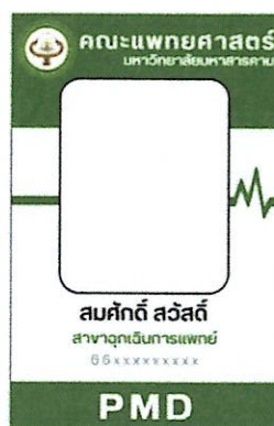
ภาพประกอบที่ ๖ ป้ายบัตรประจำตัวและสายคล้องคอ สาขาฉุกเฉินการแพทย์ (ด้านหน้า)

ด้านหลังของป้ายบัตรประจำตัวระบุรายละเอียดเกี่ยวกับข้อควรปฏิบัติในการใช้บัตร ดังนี้