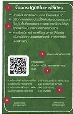
ภาพประกอบที่ ๗ ป้ายบัตรประจำตัวของนิสิตคณะแพทยศาสตร์ (ด้านหลัง)

สายคล้องคอของบัตรประจำตัวนิสิต เป็นสายผ้ามีขนาดความยาว ๙๐ เซนติเมตร และความกว้าง ๑.๐ เซนติเมตร สีของสายคล้องคอ (รหัสสี 0B2700) มีตัวหนีบบัตรตราสัญลักษณ์คณะแพทยศาสตร์ ขนาดเส้นผ่านศูนย์กลาง ๑.๓ และ ๑.๗ เซนติเมตร (รายละเอียดดังภาพประกอบที่ ๘)