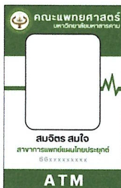
ภาพประกอบที่ ๕ ป้ายบัตรประจำตัวและสายคล้องคอ สาขาการแพทย์แผนไทยประยุกต์ (ด้านหน้า)