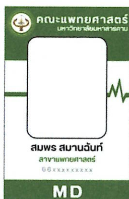
ภาพประกอบที่ ๔ ป้ายบัตรประจำตัวและสายคล้องคอ สาขาแพทยศาสตร์ (ด้านหน้า)

ข้อ ๒.๒ ป้ายบัตรประจำตัวสำหรับนิสิตคณะแพทยศาสตร์ เป็นป้ายบัตรมีขนาดความกว้างของบัตร ๖.๔๗ เซนติเมตร และความยาวของบัตร ๑๐.๐ เซนติเมตร ด้านซ้ายส่วนบนของบัตรมีตราสัญลักษณ์ของคณะแพทยศาสตร์ มหาวิทยาลัยมหิดล มีขนาดเส้นผ่านศูนย์กลาง ๑.๗ เซนติเมตร ด้านขวาบนของบัตรพิมพ์ตัวอักษร “คณะแพทยศาสตร์ มหาวิทยาลัยมหิดล” ขนาดตัวอักษร ๒๙ และ ๑๗ พอยท์ตามลำดับ ส่วนกลางของบัตรประจำตัวพิมพ์รูปประจำตัวของนิสิตเพื่อระบุสิทธิเฉพาะบุคคล ขนาดรูปภาพมีความกว้าง ๔.๒ เซนติเมตร และความยาว ๕.๐ เซนติเมตร ด้านล่างของรูปประจำตัวนิสิตพิมพ์ตัวอักษรชื่อ-สกุล สาขา รหัสนิสิต มีขนาดตัวอักษร ๒๘, ๒๐ และ ๒๐ พอยท์ ตามลำดับ มีสีตัวอักษร (รหัสสี 000000, 215A0B และ 757E72 ตามลำดับ) ด้านล่างสุดของบัตรประจำตัวพิมพ์อักษรย่อตัวพิมพ์ใหญ่แต่ละสาขา (MD, ATM, PMD) ขนาดตัวอักษร ๕๖ พอยท์ สีตัวอักษร (รหัสสี FFFFFFF) (รายละเอียดดังภาพประกอบที่ ๔, ๕, และ ๖)