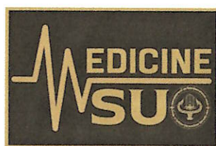
ภาพประกอบที่ ๙ หัวเข็มขัดประกอบเครื่องแต่งกายนิสิตคณะแพทยศาสตร์

ข้อ ๒.๓ หัวเข็มขัดประกอบเครื่องแต่งกายนิสิตคณะแพทยศาสตร์ โดยนิสิตชายและนิสิตหญิงสวมเข็มขัดสีน้ำตาลของมหาวิทยาลัยมหาสารคาม มหาวิทยาลัยมหาสารคาม หัวเข็มขัดเป็นอะลูมิเนียมสีน้ำตาลเข้ม (รหัสสี 373526) และสีขอบของหัวเข็มขัด (รหัสสี A48337) มีขนาดความกว้าง ๔.๐ เซนติเมตร และความยาว ๕.๘ เซนติเมตร สลักตัวอักษรพิมพ์ใหญ่ภาษาอังกฤษของคณะแพทยศาสตร์คำว่า "MEDICINE" รูปแบบตัวอักษร คือ Karnchang Semicondens ขนาดตัวอักษร ๒๘ พอยท์ และสลักตัวอักษรพิมพ์ใหญ่ภาษาอังกฤษของมหาวิทยาลัยมหาสารคาม คำว่า "MSU" รูปแบบตัวอักษร คือ Angsana Semi Condensed ขนาดตัวอักษร ๔๔ พอยท์ สีตัวอักษรทั้งหมด (รหัสสี A48337) มีตราสัญลักษณ์ของคณะแพทยศาสตร์ มหาวิทยาลัยมหาสารคาม สลักบริเวณด้านขวาส่วนล่างของหัวเข็มขัด ขนาดตราสัญลักษณ์ ๑.๒๓x๑.๒๕ เซนติเมตร สีตราสัญลักษณ์ (รหัสสี A48337) (รายละเอียดดังภาพประกอบที่ ๙)